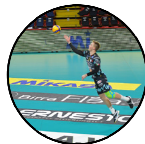
SIR SAFETY PERUGIA VOLLEY