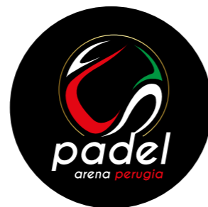
PADEL ARENA PERUGIA