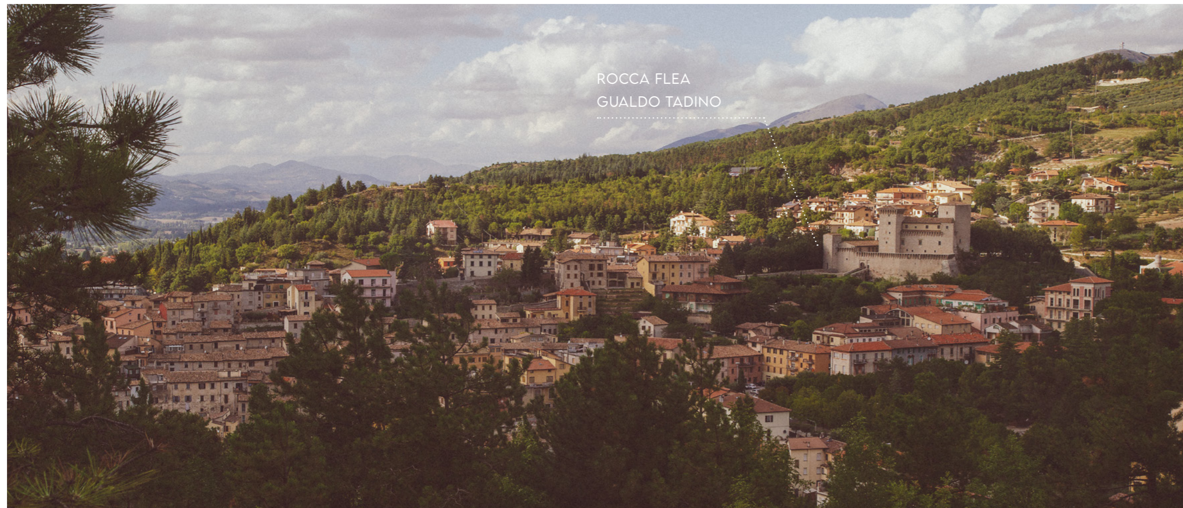
ROCCA FLEA GUALDO TADINO