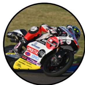
SIC SQUADRA CORSE