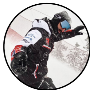
SCUOLA SKI RAINELTER MADONNA DI CAMPIGLIO