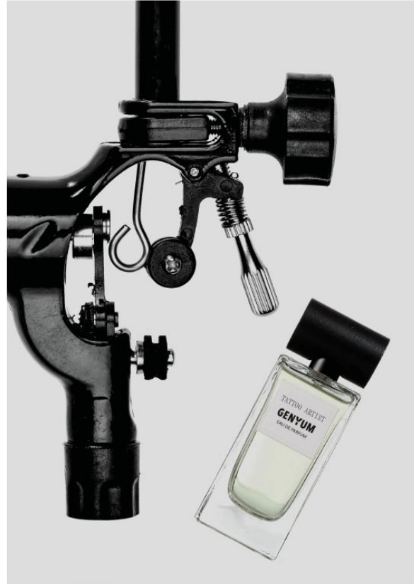
Tattoo Artist de Genyum .

Un tatuaje es para siempre, un perfume también